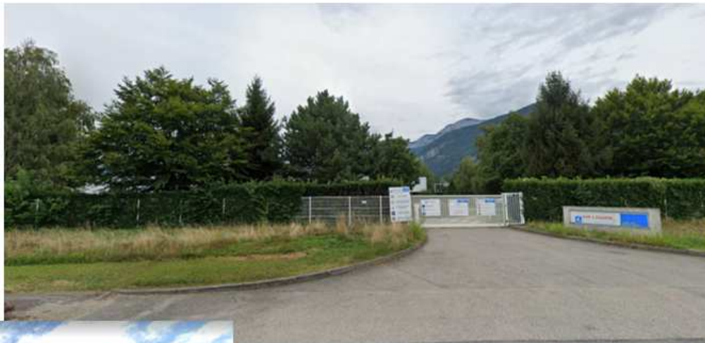
Vue 1 depuis l'entrée principale au Nord, chemin des Mariniers (Sept 2019)