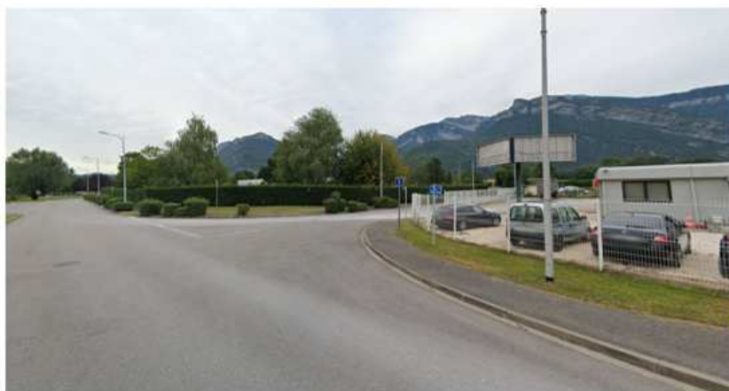
Vue 4 depuis le chemin des Mariniers (Sept 2019)