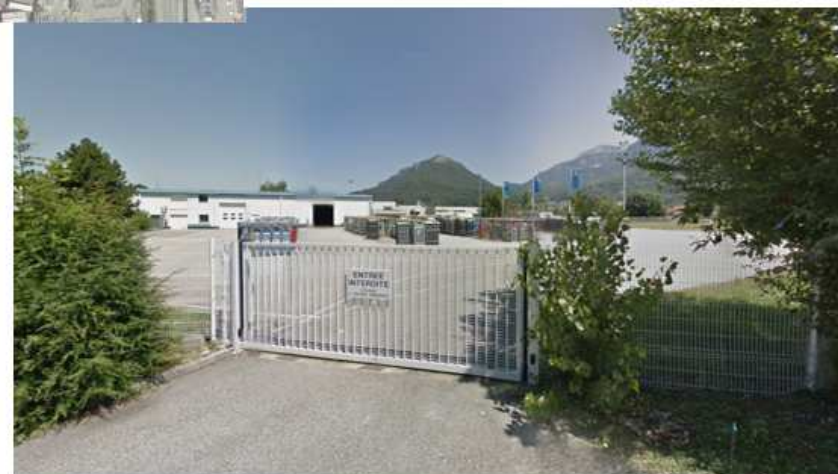
Vue 3 depuis l'entrée Sud, chemin des Mariniers (Juillet 2012)