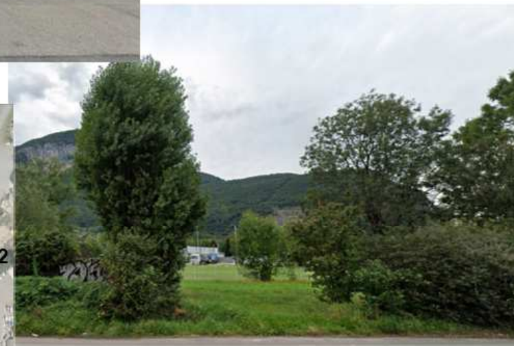
Vue 2 depuis la route D3 (Sept 2019)