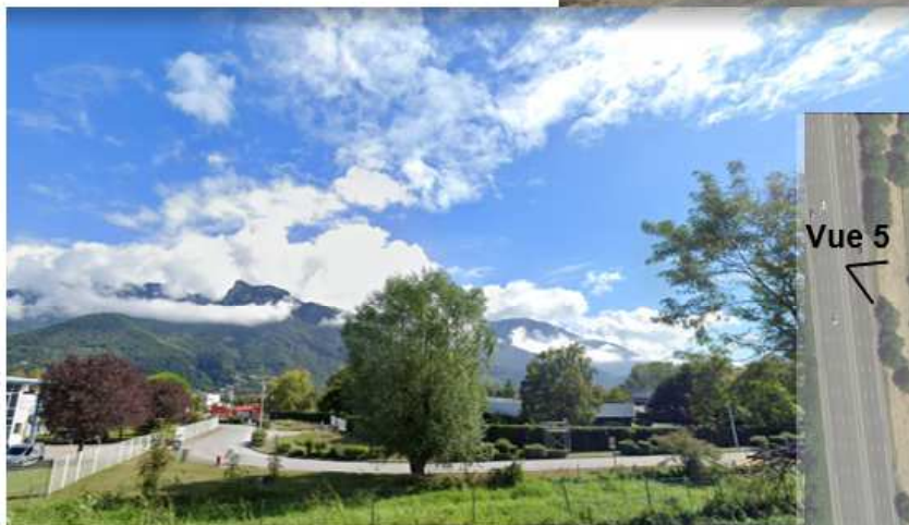
Vue 5 depuis l'autoroute A48 (Sept 2019)