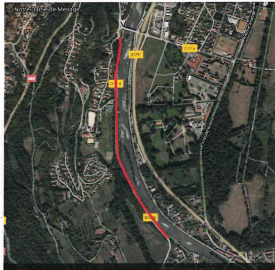
Tronçon de 1310 m de la route départementale 101A