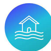
Les autres acteurs : Le conseil départemental, les syndicats de rivières, les gestionnaires de digues, etc.