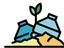
Les autres acteurs : Les bureaux d'études, les associations de riverains, etc.