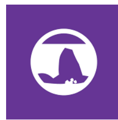
Les autres acteurs : BRGM, INERIS