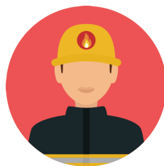
Le service départemental d'Incendie et de Secours (SDIS)