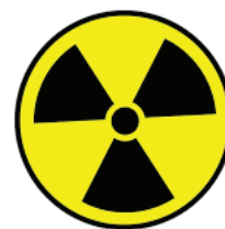
Les autres acteurs : EDF, ASN, IRSN, Associations agréées de sécurité civile.