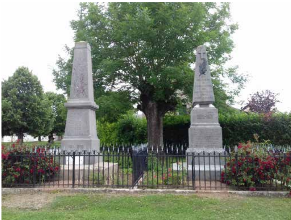
Monument aux morts de Loigny-la-Bataille (28)