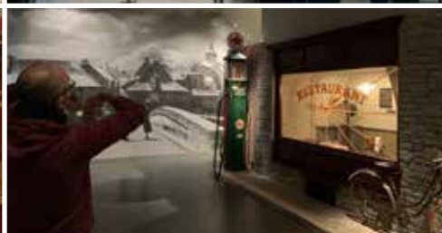
Musée de la résistance de Saint-Marcel (56)