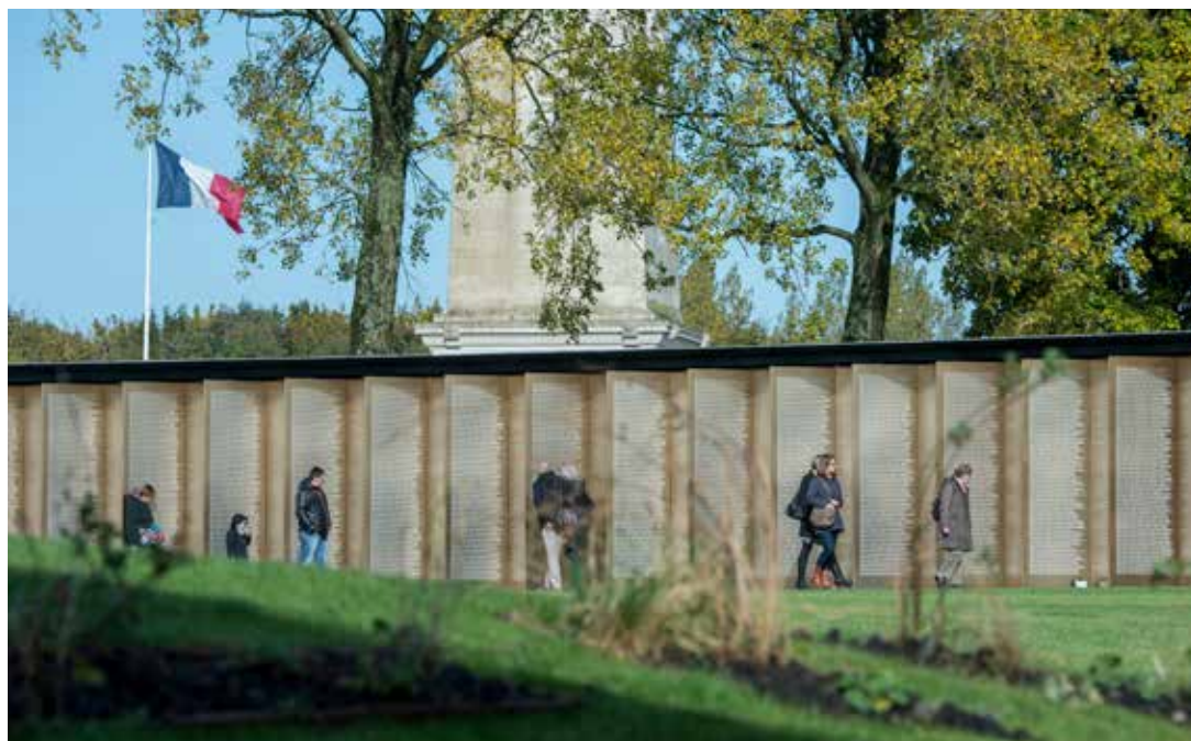
La nécropole de Notre-Dame de Lorette, haut lieu de la mémoire nationale (62)