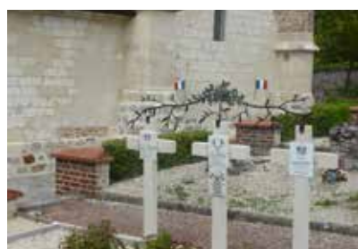
Tombes de restitués de Combes (02)

Si l'État a octroyé des concessions perpétuelles aux soldats attributaires de la mention « Morts pour la France », il a également laissé le choix aux familles de pouvoir réclamer les corps de ces soldats conformément à l'article L521-1 du CPMIVG. Dans ce cas-là, le statut de sépulture privée s'applique et l'entretien revient à la charge des familles. On les retrouve toujours dans les cimetières communaux. Elles peuvent également être présentes dans un carré mixte (qui réunit des sépultures perpétuelles et des sépultures de soldats restitués) sans que cela ne change leur statut.