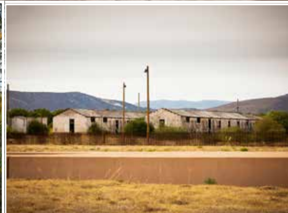
Mémorial du camp de Rivesaltes (66)