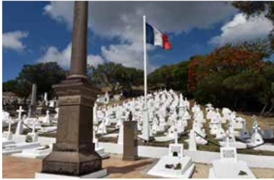
Carré militaire de Nouméa (Nouvelle-Calédonie)