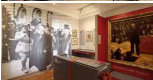
Musée Clemenceau (75)