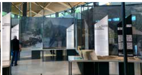
Historial du Hartmannswillerkopf (68)