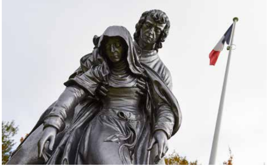
Nécropole nationale Vaux-Racine à Saint-Mihiel (55)