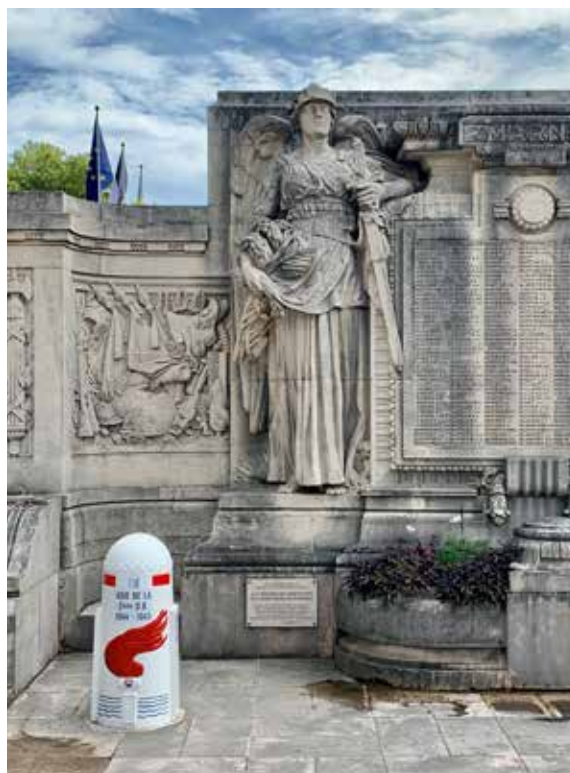
Borne de la 2 e DB – Versailles (78)