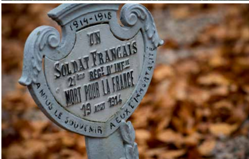
Nécropole nationale de Wisches (67)