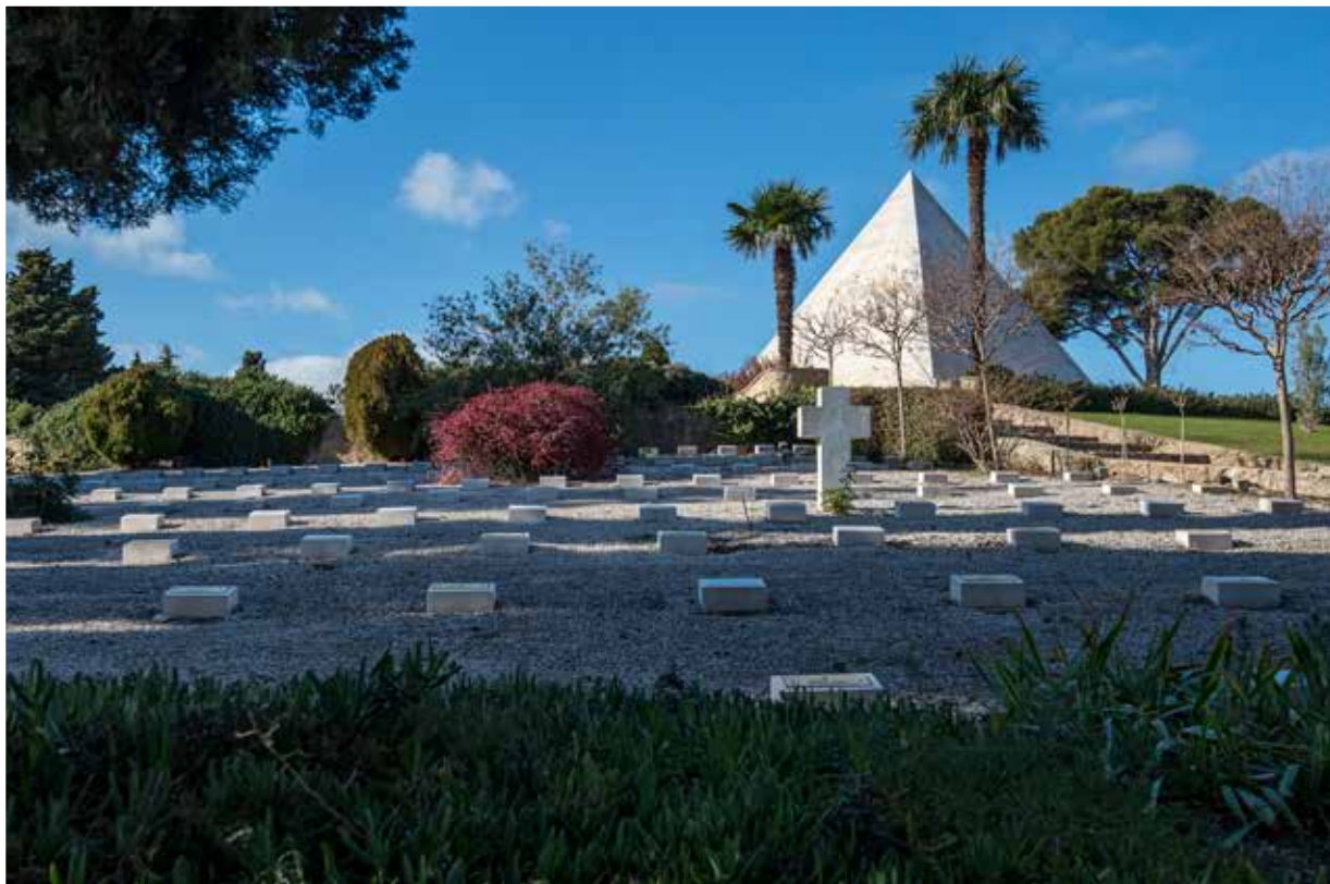
Monument dans la nécropole nationale de Saint-Mandrier- sur-Mer (83)