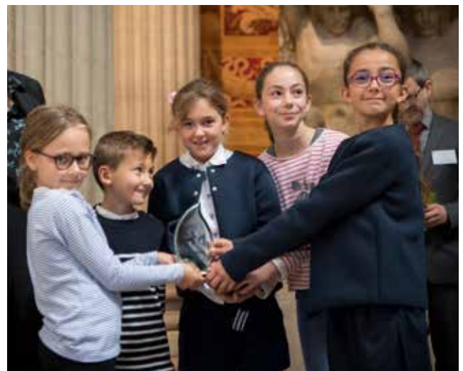
Cérémonie Héritiers de mémoire