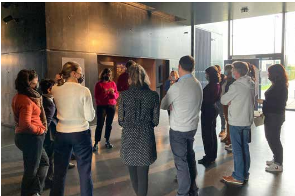
Séminaire RMMCC au Centre d'histoire du mémorial 14-18 de Notre-Dame de Lorette (62).

La demande d'autorisation d'installer un panneau de signalisation touristique sur une route départementale est à adresser au service de la voirie du conseil départemental compétent. La DMCA peut être tenue informée par le requérant afin d'obtenir son agrément.