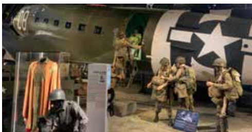
Airborne Museum (50)