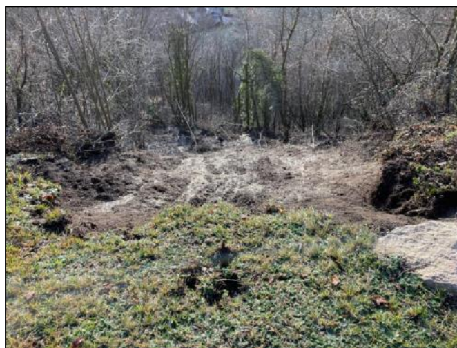
Figure 1. clichés de la zone en glissement ayant déclenchée la chute des blocs (source SAGE)