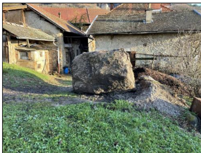
Figure 2. clichés des blocs éboulés