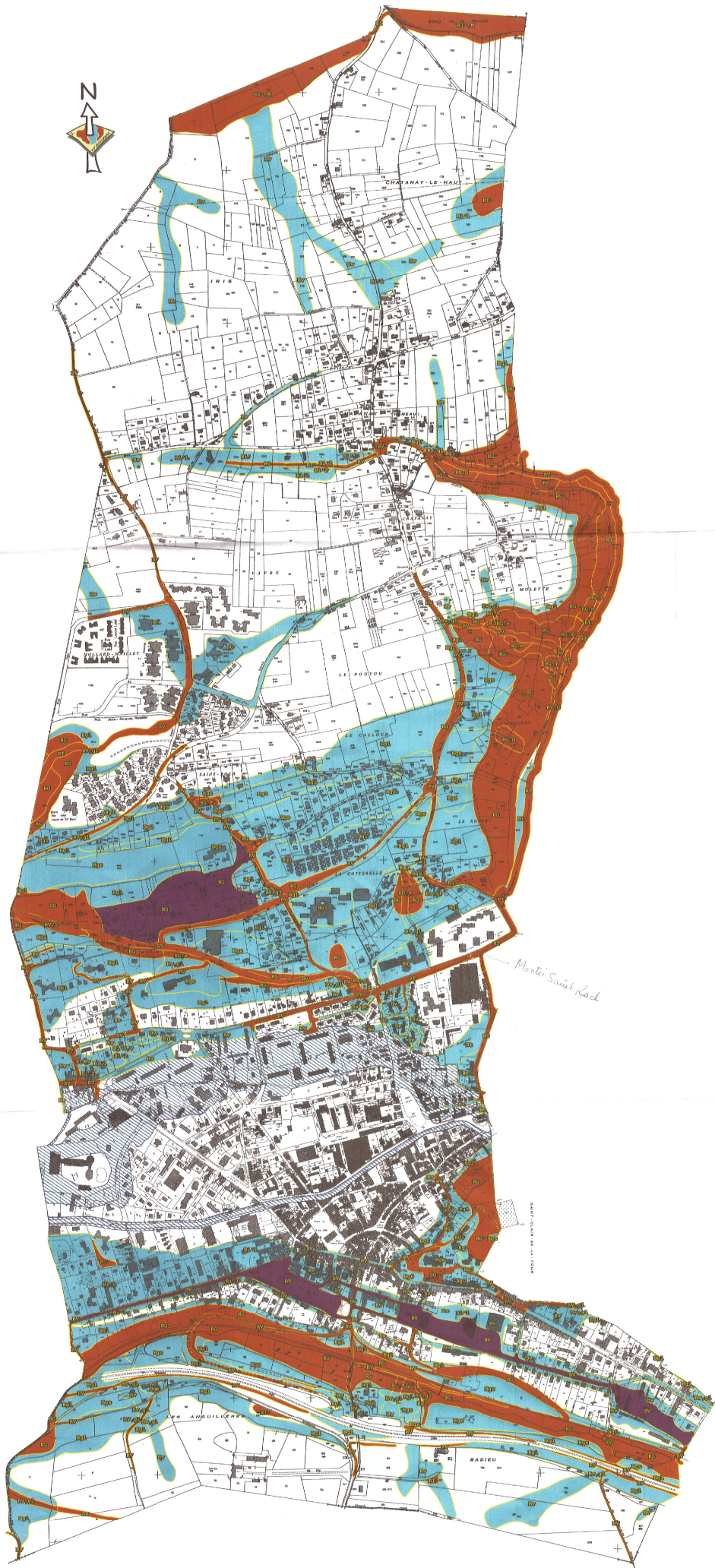
Zonage réglementaire du risque ruissellement de versant (phénomène généralisé)